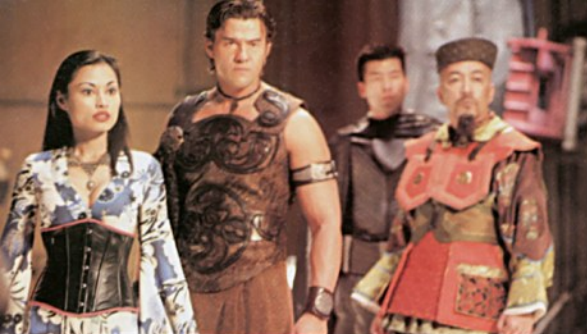
Als Lord Camulus stand Bacic für STARGATE SG-1 vor der Kamera