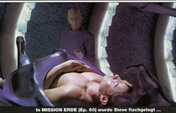
In MISSION ERDE (Ep. 60) wurde Steve flachgelegt ...